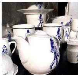
| On the fair |