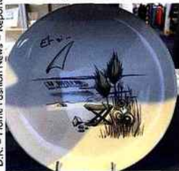
| Faïencerie de Pornic x Angelique |