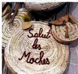
| Le coin du chat |