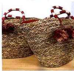
| Histoires |