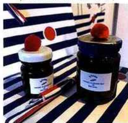
| Le Pompon |