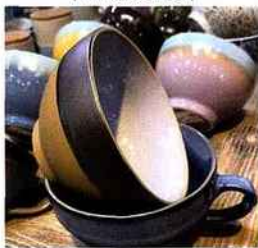
| Ze souvenir |