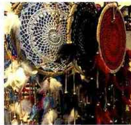
| ICD |