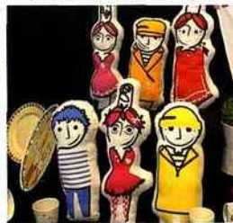
| On the fair |