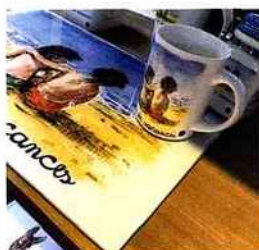
| Ze souvenir |