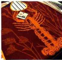
| Tissage Moutet |