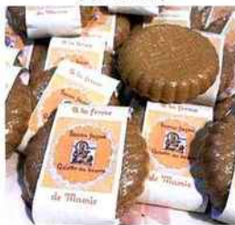
| La ferme de Mamie |