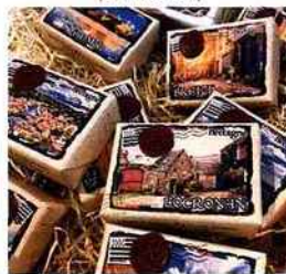
| Les savons de Grand-mère |