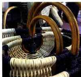
| On the fair |