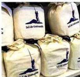
| Artisans du sel |