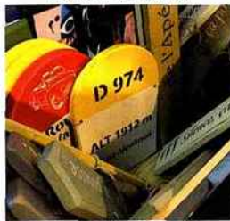
| Qualiart |